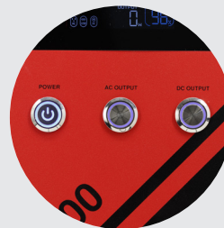
Botões de controle