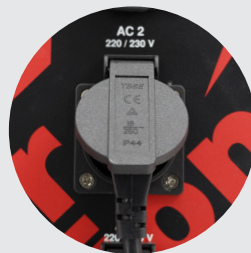
3x Conexões AC IP44