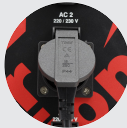
3x Conexiones AC IP44