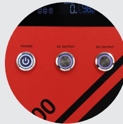
Botones de control