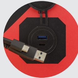
USB-A und -C