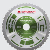
Lame de scie 48 dents ESB.150.48T