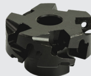
Fräskopf Code: B60.0027