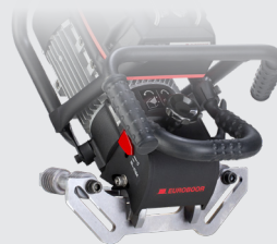
Edelstahlplatte Zur Verwendung bei Edelstahlmaterial Code: B60.1020S